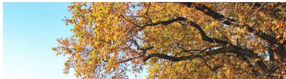
Arbres du Parc des Evaux