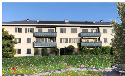
Immeuble du 7-9 Hutins rénové entouré d'un espace vert renaturé. (Image de synthèse après rénovation)

La commune voulait céder une parcelle à la Fondation du logement pour réaliser un projet de démolition/reconstruction financièrement mal ficelé, environnementalement désastreux, questionnable en matière de sécurité routière et incertain pour les habitantes et habitants actuels. Notre référendum a permis d'accéder à des éléments cachés du dossier et montré que la population est contre la densification à tout prix. Transparence, responsabilité et prévoyance.