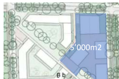
Zone scolaire prévue en 2019

Le canton avait prévu 5'000 m 2 pour la future école aux Cherpines. Nous avons insisté pour l'agrandissement du périmètre de l'école à 18'000 m 2 comprenant une crèche en bonne et due forme. L'éducation de demain se prévoit aujourd'hui.